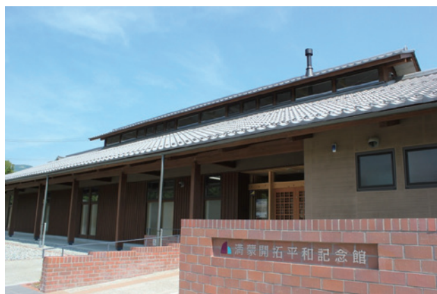
▲満蒙開拓平和記念館(長野県阿智村)

全国で最も多くの開拓団を送出した長野県南部に「満蒙開拓」に特化した記念館を設置し、歴史・資料の記録・保存・展示・研究を行い、後世に正しく歴史を伝えるための拠点としようと、2013年にオープン。満蒙開拓語り継ぎ活動の拠点、残留邦人の交流の場として、また戦争、そして多くの満蒙開拓移民を送り出した〈負の歴史〉からアジア・世界に向けた「平和・共生・友好の未来」創造への発信拠点を目指しています。